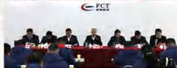
福港集箱 2023 年党建暨党风廉政建设和反腐败工作会议 2022 年度党组织书记抓基层党建工作述职评议