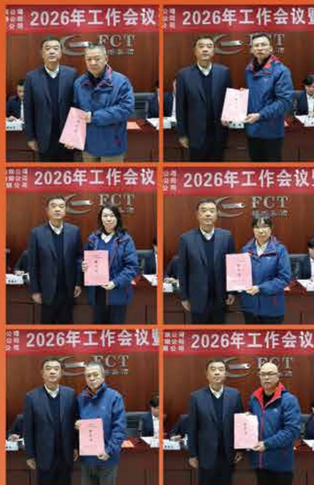
会议下达2026年度安全生产目标管理责任书。