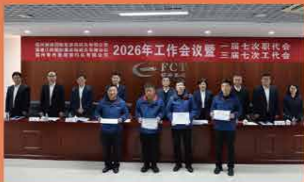
会议对2025年度公司先进表彰。