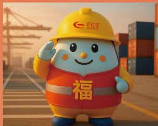
文：王焱、郑学胜