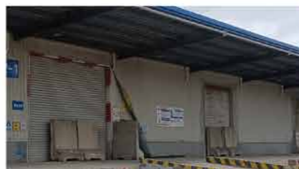
▲江阴港区粮食仓库卷帘门用水泥挡蹲顶防