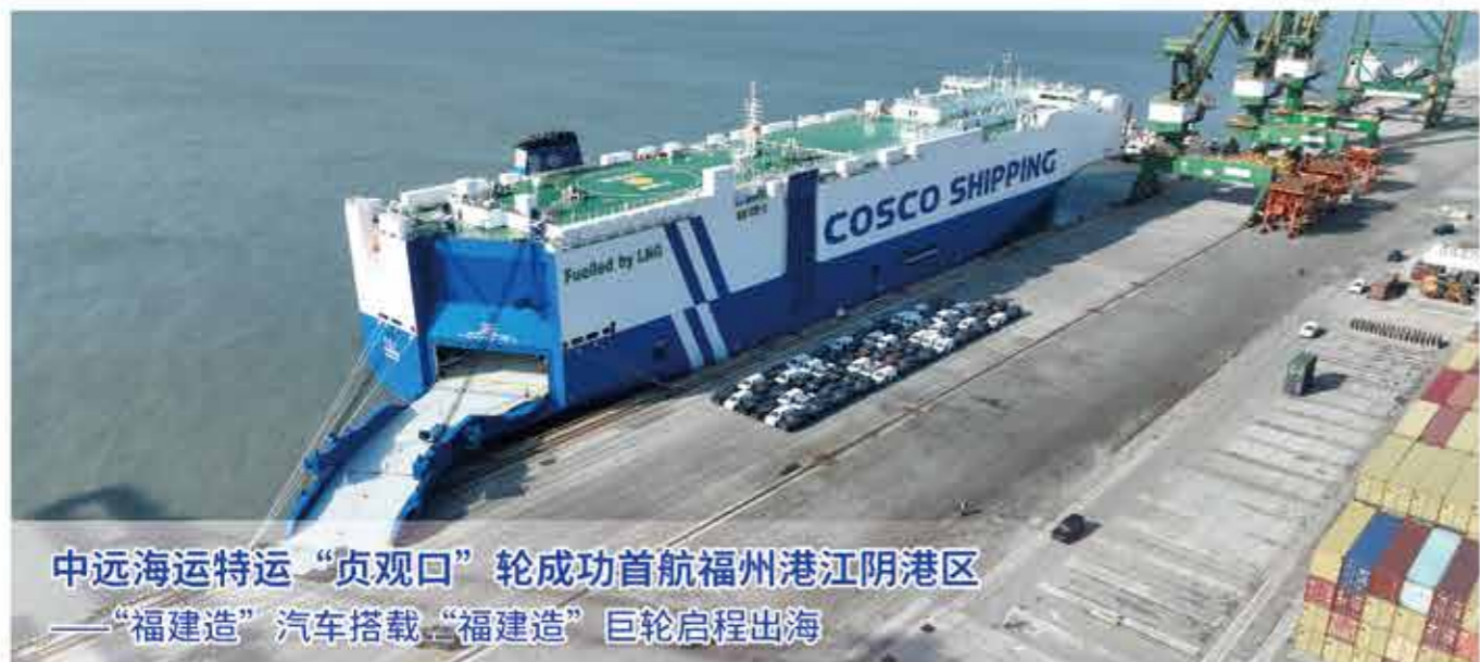
中远海运特运“贞观口”轮成功首航福州港江阴港区 ——“福建造”汽车搭载“福建造”巨轮启程出海

2025年12月4日，由中远海运特运运营、7500个标准车位并采用LNG双燃料动力的大型汽车滚装船“贞观口”轮顺利首航福州港江阴港区并完成装载作业。该轮于今年11月27日在福建厦门顺利下水，此次首航承载689台“福建造”奇瑞汽车，从福建启程驶往中东市场，“福建造”高端船舶与“福建造”汽车协同出海，展现了福建制造、产业配套与港口物流链深度协同发展的新进展。