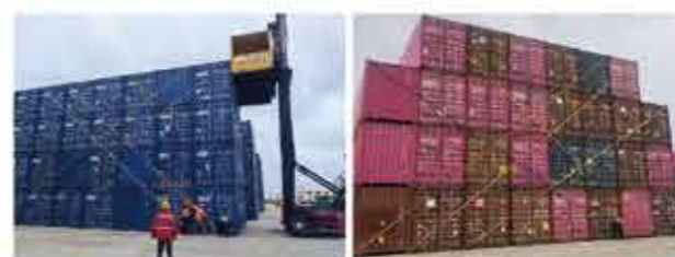
▲江阴、青州港区在空箱防台绑扎

四、确保安全有序撤离，力争高效快速复产。 一旦台风达到危险级别，立即停止现场作业，有序组织人员撤离至安全区域，并设置醒目的警示标识。同时密切关注台风动向，提前谋划复产工作，明确复产流程与时间节点，力争最短时间内恢复生产运营正常秩序。