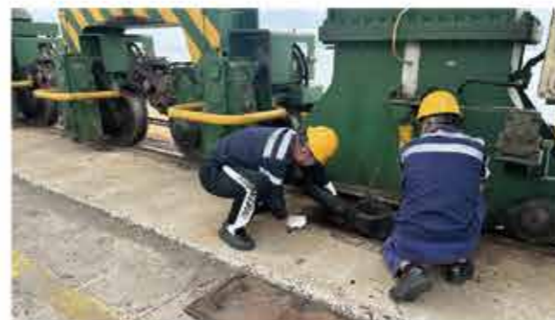
▲江阴港区前沿大型设备锚定绑扎