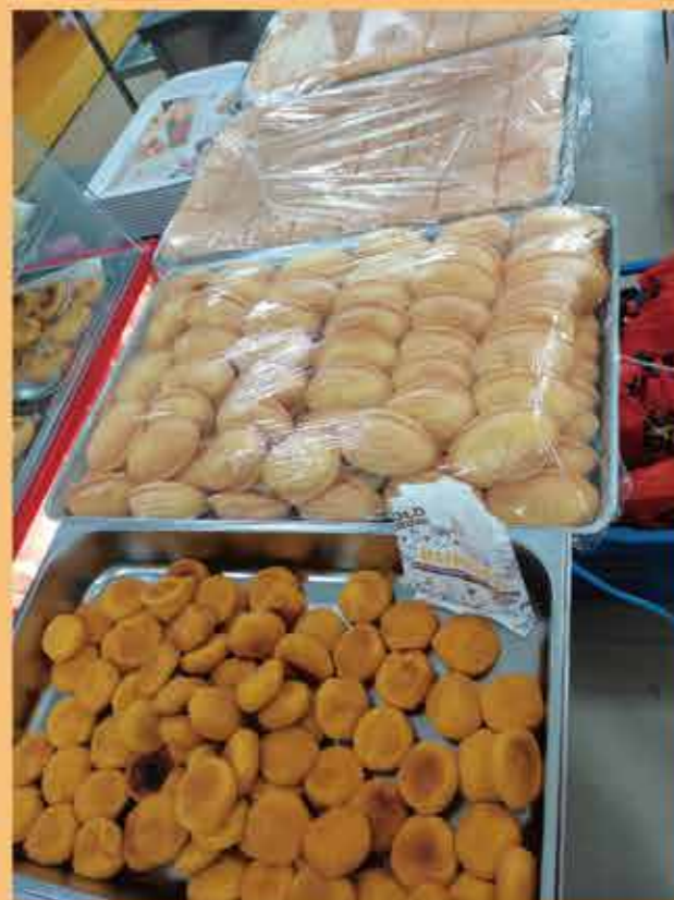
文：张莉萍 图：冯文玉