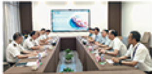
（文：吴树群、李树群）

座谈会上，调研团重点围绕当前国际形势、港口运营现状等主题：一是江门港区 6-7# 泊位自动化码头建设进度；二是海美智慧运营系统与港口生产系统互联互通；三是保税港区智慧化转型升级的规划；四是完善智慧运营全流程智能化运营机制。双方通过交流，进一步加深了解，为全力推进港口智能化建设、智慧化管理及区域高质量发展奠定了坚实基础。