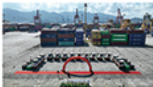
青洲港区新能源牵引车交付现场

近年来，福建集运持续加大绿色港口建设力度。截至目前，两港区共更新配置了 10 台纯电动渣土车和 50 台新能源牵引车。多点联动形成绿色车队，运输流程的绿色作业体系。未来，福建集运将继续推动绿色转型升级，力争为行业新能源设备应用树立智能化与绿色低碳化的新标杆。