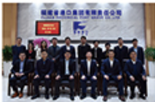
（文：陈宇韬）