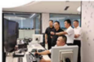
（文：陈宇韬）

此次调研交流加深了彼此了解。双方以此次交流为契机，探索合作模式，加强区域协同，共促港口高质量发展。