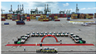
江阴港区新能源牵引车交付现场

本次集中交付的新能源牵引车在光电效率、续航里程、能源消耗等关键指标上实现全面优化，并集成智能化的港口运输调度管理平台和远程可控化的 AI 监控系统。具备科学智能调度、主动预警等功能，能显著提升港口作业效率、精细化、重安全的要求。两港区预计每年合计可节约柴油 1200 吨，减少碳排放约 3500 吨，大幅提升港口绿色物流竞争力。