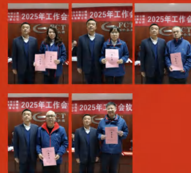
会议下达2025年度安全生产目标管理责任书。