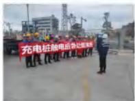
▲抢险救援组对伤员实施胸外心脏按压急救措施。