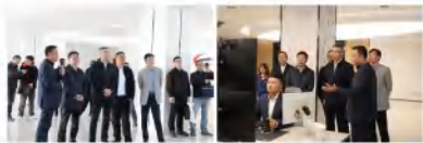
福州市、福清市等相关部门负责人参加。

赵明正副市长在认真听取汇报后，对福港集箱所取得的工作成果给予了充分肯定。他指出，江阴港区要充分利用自身优势，凭借江阴港区这一重要平台，充分发挥“侨资源”优势，深度融入共建“一带一路”倡议，汇聚全球资源，拓宽发展空间，全力打造对外开放大通道，为经济高质量发展增添新动能。同时，要将港区建设成为改革创新发展和港产城一体化发展的示范标杆，以创新驱动引领港区发展，促进港口、产业与城市的有机融合，实现互利共赢的良好局面。此外，赵明正副市长还提出，港区应继续加大投入力度，在提升航线网络、加密航班密度、优化服务品质等方面持续发力，不断提升港口综合实力，坚定不移地朝着世界一流深水大港的目标迈进。