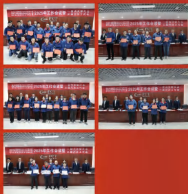
会议对2024年度公司先进个人进行表彰。