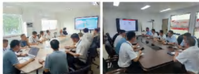
(文：吴勋、林婧文、钟明发)

一要提前部署，紧绷安全弦：依据《2024 防台、防汛专项应急预案》，督促各相关部门密切关注台风动态，确保在“山陀儿”登陆前，完成在港船舶作业及离泊。重点加强大型设备、在场空箱、危险货物堆场、散杂货与整车堆场、外协承包区的防台加固工作，确保万无一失。二要排查隐患，确保安全稳定：全面排查潜在风险，对发现的隐患立即整改，紧盯关键环节，严格执行防台值班制度，加强现场巡查，做好后勤保障，确保港区安全稳定。三要人员疏散，保障生命安全：防台期间，港区将现场全面封闭，所有作业人员有序撤离至安全地带，确保人员安全。台风过后，将迅速评估现场，第一时间恢复生产，保障港区运营。会议强调，各部门需压实责任，确保防台措施落实到位，做好人员备勤安排，确保国庆期间防台响应及时，为港区安全、平稳运行保驾护航，为国庆佳节增添了一份安心与祥和。