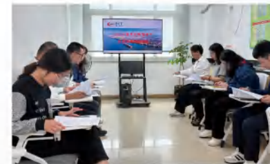
(文：姚维佳 图：林良知)

演练结束后，参演各方展开了深入交流与讨论，对照预案的实际执行情况，仔细查找其中存在的漏洞与短板，并提出一系列优化建议。此次演练不仅充分验证了《2024年度突发舆情事件应急处理预案》的有效性、实用性，更激发了团队成员的责任感与使命感，极大提高了应对实际挑战时的协同作战能力。未来，福港集箱将持续完善突发舆情事件应急处理预案体系，不断加强培训与实战演练，确保员工熟练掌握应对策略，共同捍卫公司的荣誉与形象。