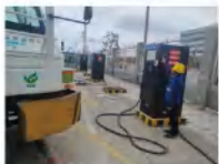
▲触电事件发生，现场监管人员按下紧停键。

本次演练模拟拖车驾驶员在 7 号岗充电桩区域进行充电时不慎触电，危机时刻，现场监管人员果断按下紧停键，技术部电房班组迅速响应，即刻切断故障充电桩电源，防止二次伤害发生。紧接着，安全环保部的抢险救援组火速赶到，采取专业的急救措施，如胸外心脏按压，争分夺秒地挽救伤员生命。整个过程紧张而有序，展现了团队的高效协作与专业素养。